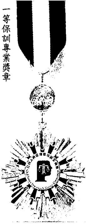
一等保訓專業獎章