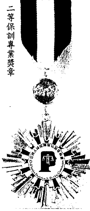
二等保訓專業獎章